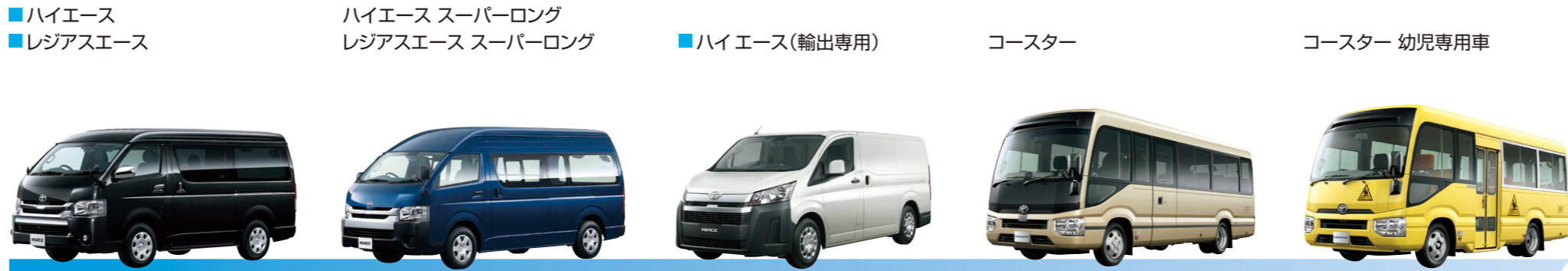
商用車・コンピューター