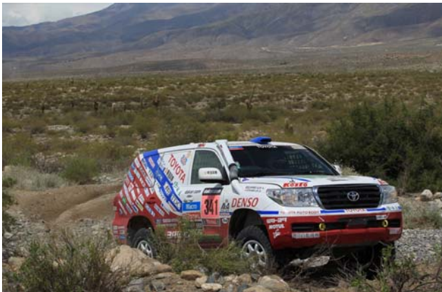
ダカールラリー2013 大会の様①