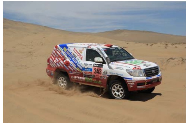
ダカールラリー2013 大会の様②