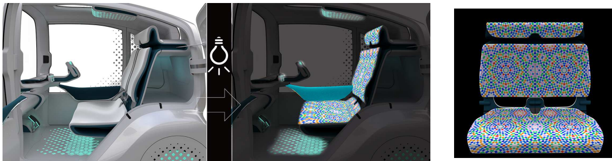
UVライトで柄が浮かび上がる

また、ステージキャストが着用する衣装もアンリアルエイジが担当します。WONDER-CAPSULE CONCEPTを担当するキャストの衣装は、UVライトが当たると柄が浮かび上がります。