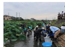
工場周辺池での外来種駆除と環境学習の様子