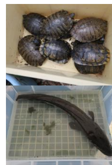
捕獲した外来種 上：ミシシippアカミミガメ 下：カムルチー（ライギョ）