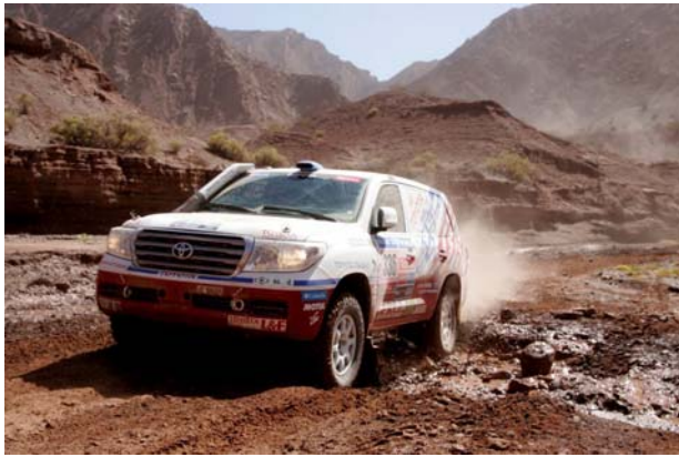
(1号車：三橋/アラン組)