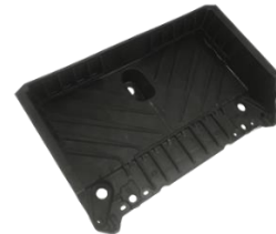
バッテリーキャリア