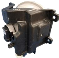
フォグランプブラケット

海外向けハイエースをはじめとした9車種に、TABWD®を使用した部品が採用されてきました。