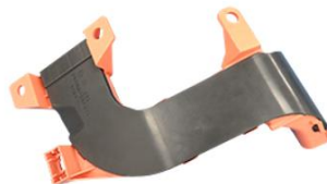
ワイヤーハーネスカバー